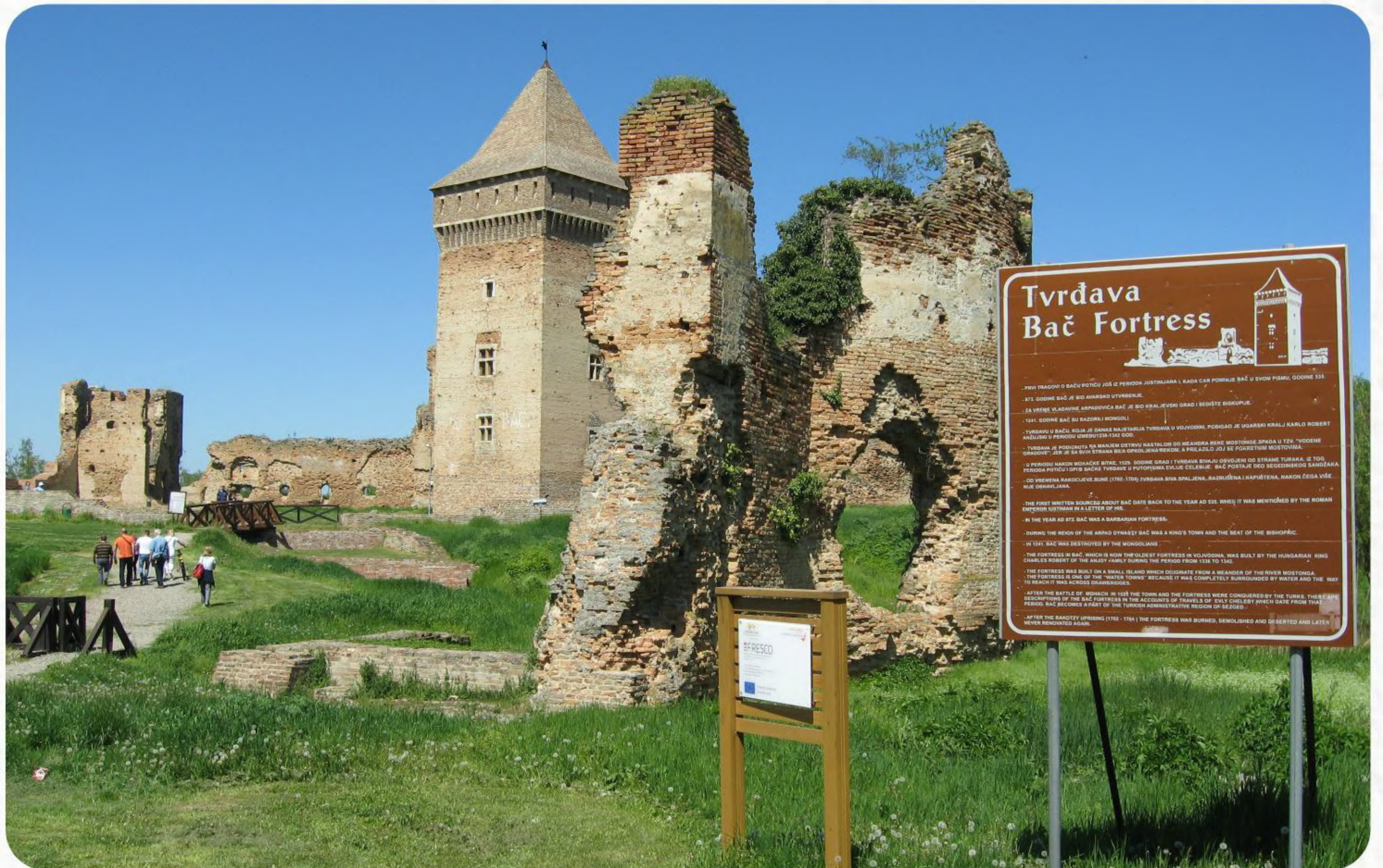
Bogato arhitektonsko i arheološko nasleđe Bača očuvano je i zahvaljujući podršci Evropske unije koja je finansirala veliki projekat obnove franjevačkog samostana koji datira iz 13. veka, kao i sređivanje prilaza tvrđavi u Baču (prva polovina 14. veka). Uz pravoslavni manastir Bođani (15. vek), taj kompleks u Baču obuhvatio je različite arhitektonske uticaje – od romanskog i gotskog, preko islamskog i baroknog do klasicističkog.