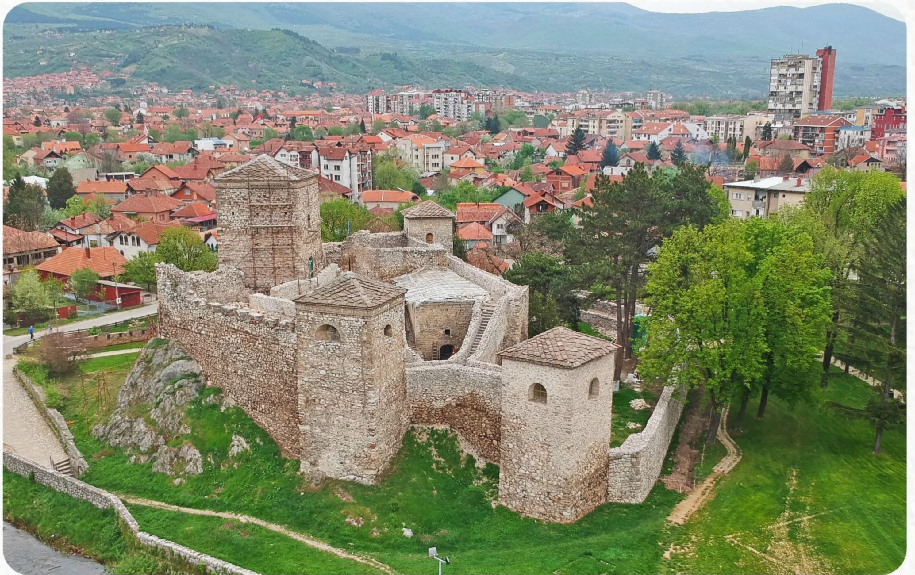
Tvrđava u Pirotu (Momčilov grad ili tvrđava Kale), podignuta u drugoj polovini 14. veka, jedna je od turističkih atrakcija južne Srbije. Tvrđava je dugo - od srednjeg veka do prve polovine 20. veka - korišćena u vojne svrhe. Danas je to kulturna i istorijska baština u čije očuvanje ulaže i Evropska unija: obnova tvrđave Kale sprovodi se sredstvima iz Programa prekogranične saradnje Srbija-Bugarska.