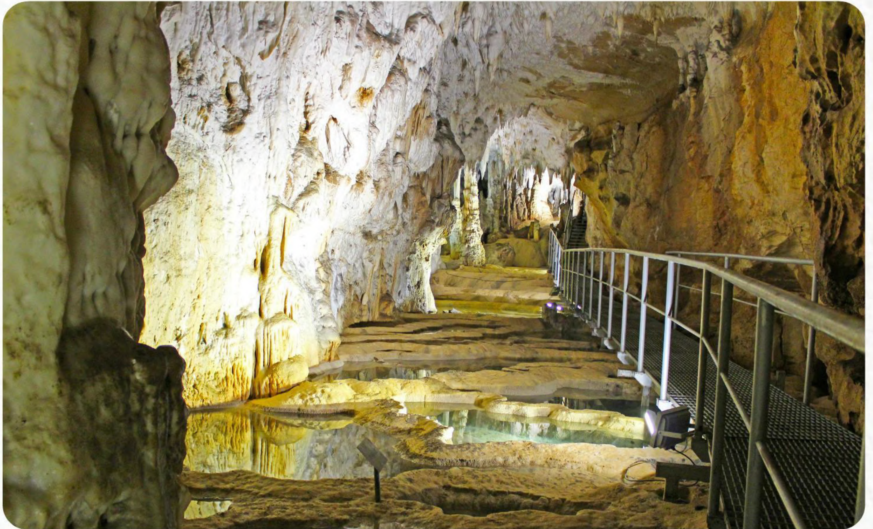
Rajkova pećina kod Majdanpeka speleološki je spomenik prirode koji je prvi opisao čuveni srpski geograf Jovan Cvijić. Odlikuje je pećinski nakit izrazito bele boje. Nazvana je po hajduku Rajku za koga se veruje da je živeo u 19. veku i danju radio kao mehandžija a noću otimao blago turskih karavana i skrivao ga u pećinu. Zahvaljujući projektu Evropske unije „Sociojalno-ekonomski razvoj dunavske regije u Srbiji“, pećina je dobila kružnu stazu dugu 1.400 metara i modernu rasvetu.