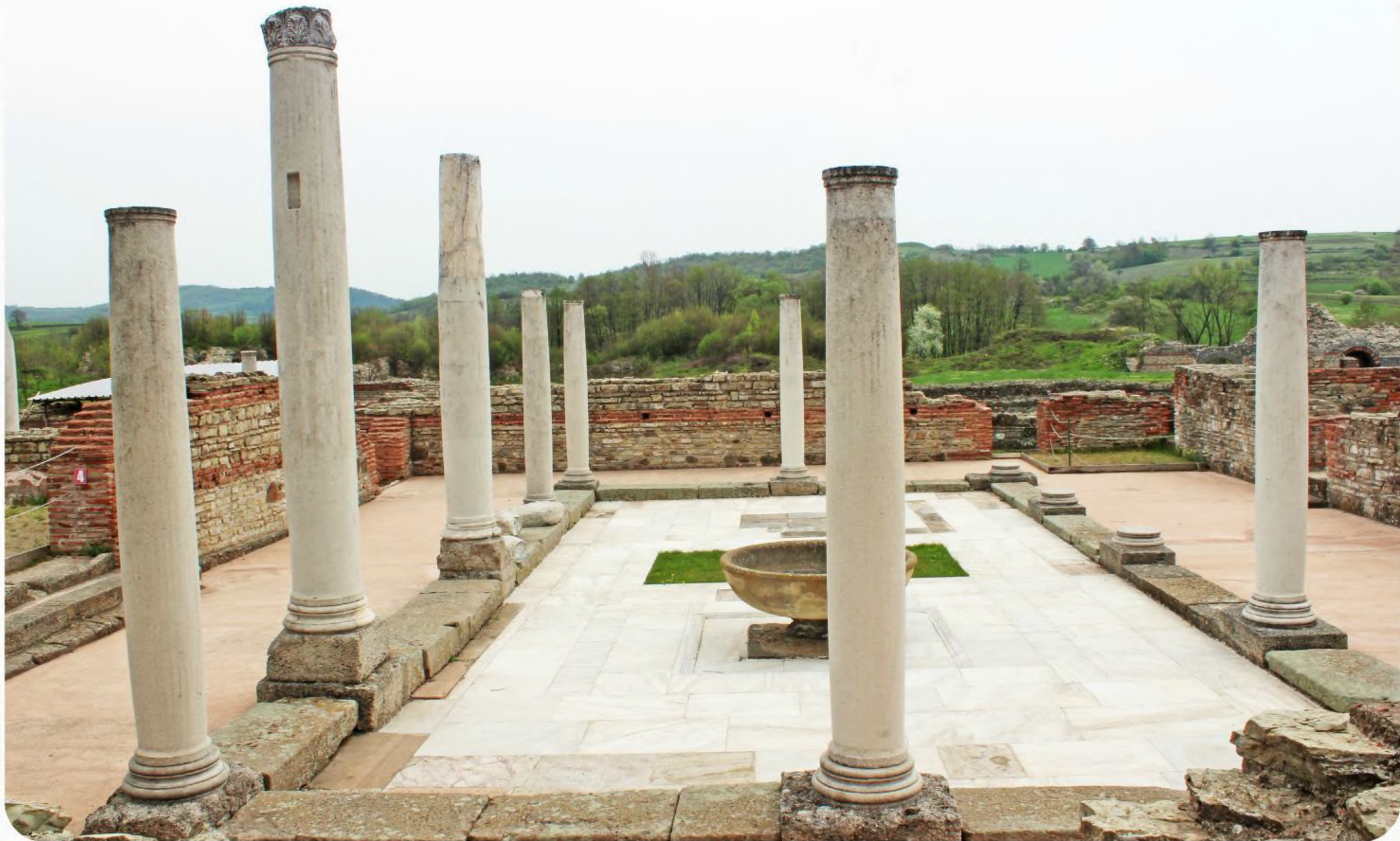
Feliks Romulijana , carska palata podignuta krajem 3. i početkom 4. veka po zamisli rimskog imperatora Galerija Maksimilijana, na listi je svetske baštine UNESCO-a. Smeštena na prostranom platou Gamzigrada kod Zaječara, palata je jedan od najočuvanijih spomenika rimske dvorske arhitekture iz perioda tetrahije. Donacijom Evropske unije, u Gamzigradu su završeni radovi na tri kule i opremljen je savremeni multimedijalni centar za posetioce.