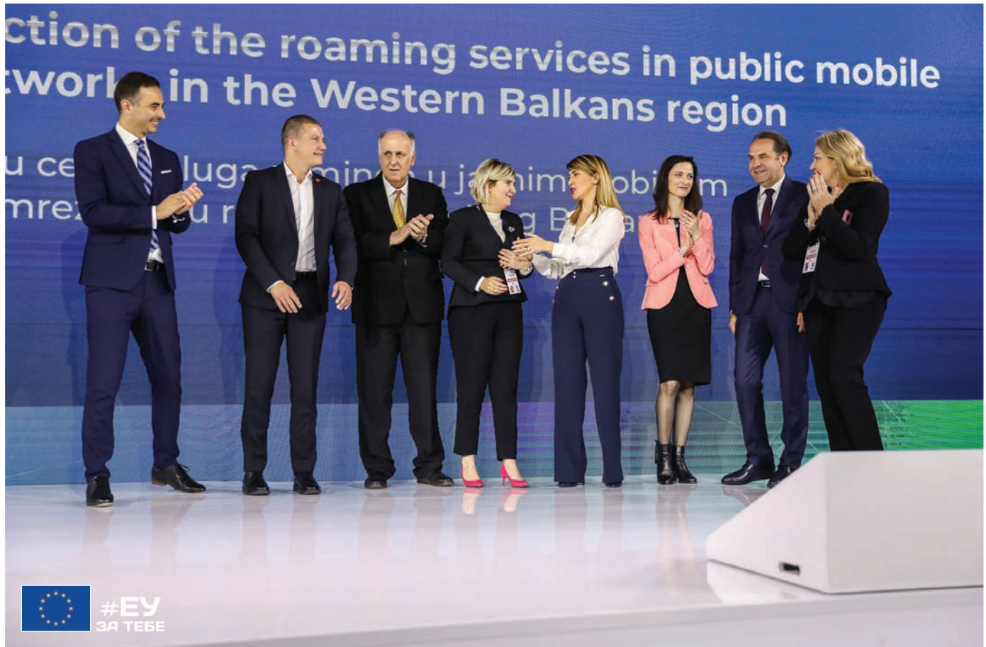
Током Дигиталног самита Западног Балкана у Београду, априла 2019. године, потписан је регионални споразум који ће смањити цене роминага (до потпуног укидања) и приближити грађане региона једне другима.