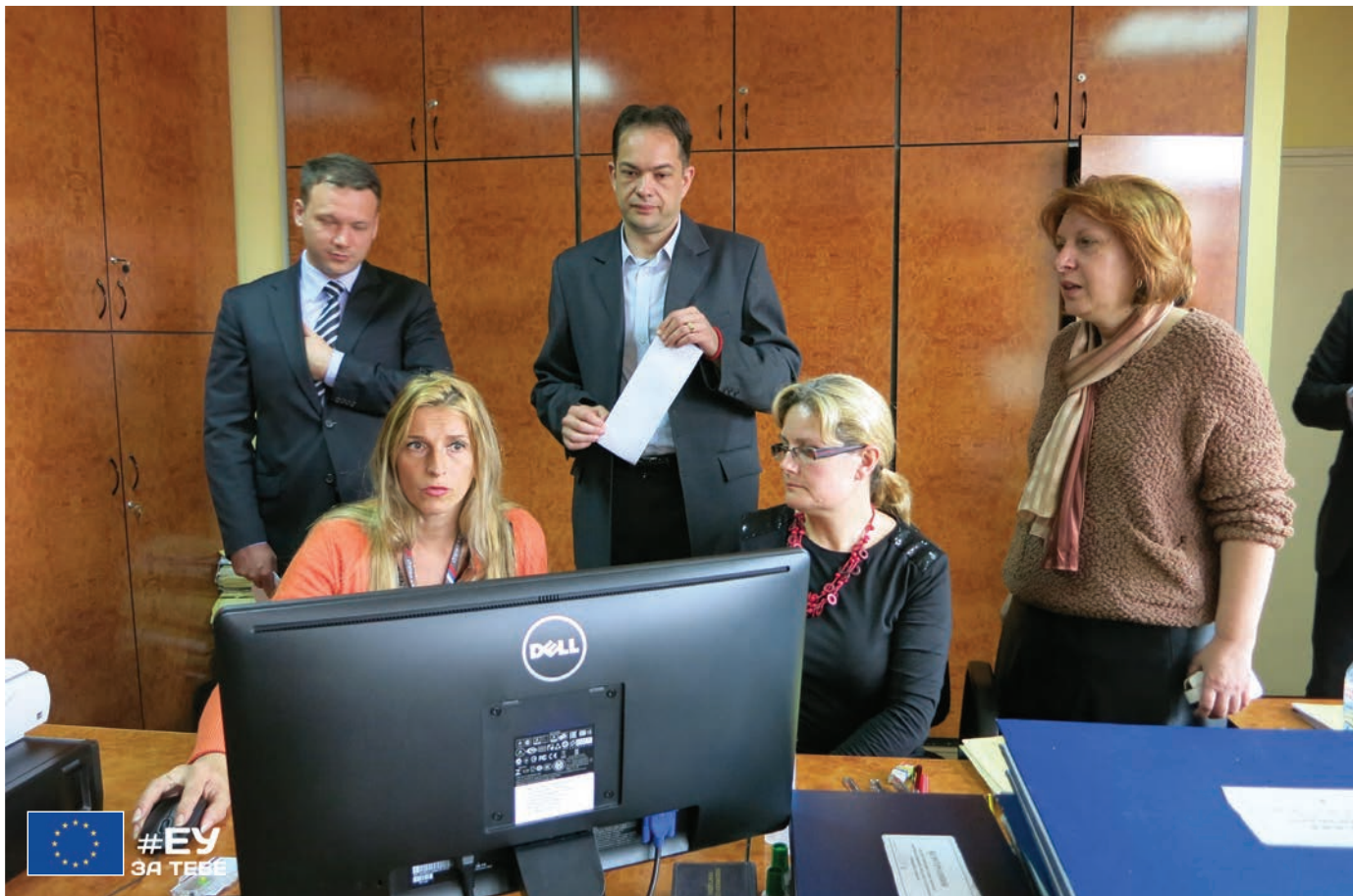
Дигитализована писарница Основног суда у Ужицу кроз пројекат ЕУ „Унапређење ефикасности у правосуђу“. Захваљујући овом пројекту, више од 700 хиљада грађанских и привредних предмета добило је епилог.