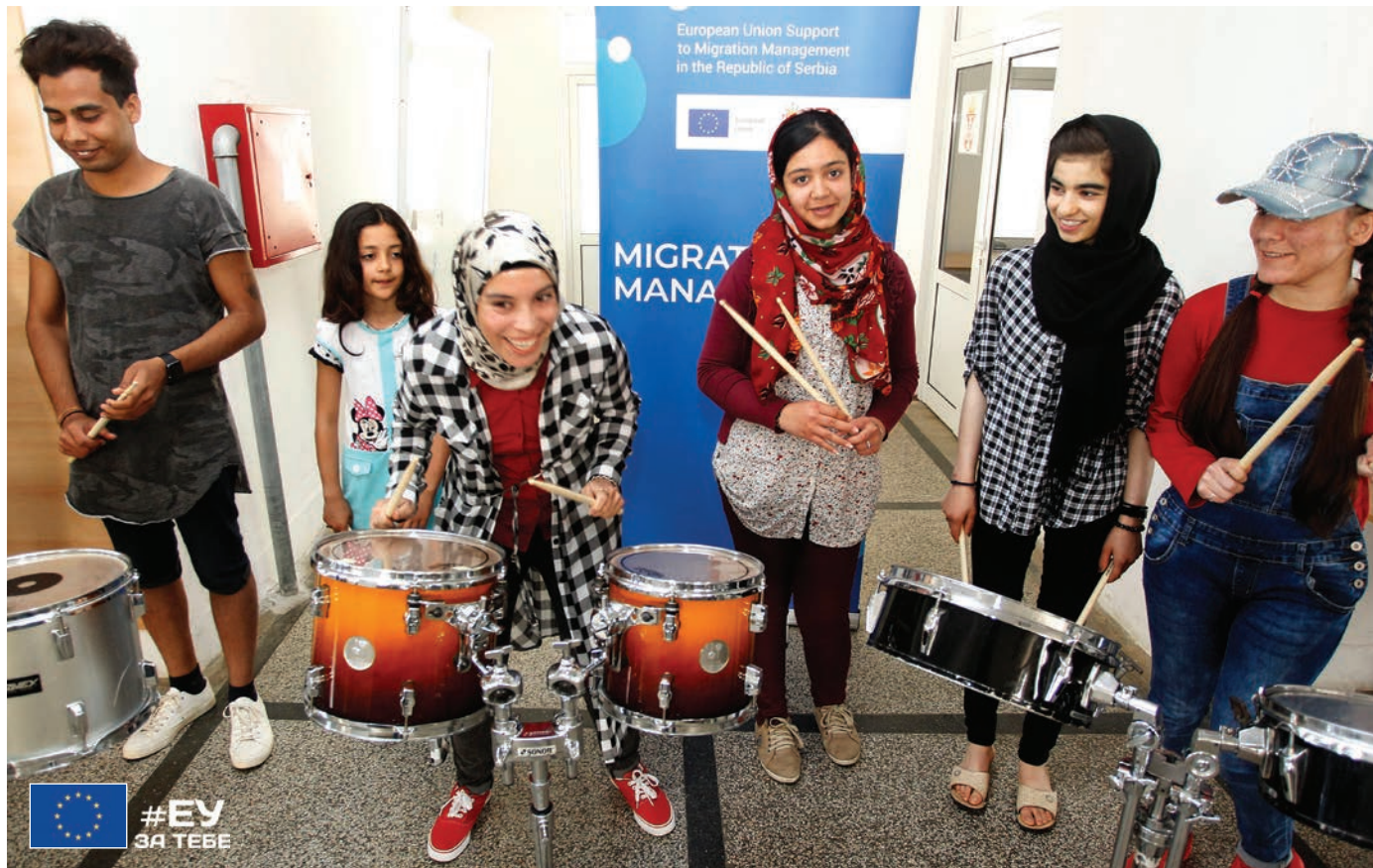
Деца у Прихватном центру за мигранте кроз едукативне садржаје уче нове вештине и креативно проводе слободно време. Управљање миграцијама за ЕУ значи заштиту друштва уз истовремено старање о заштити права и достојанства.